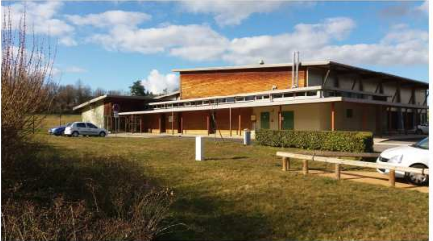
Le boulodrome de St Rémy qui accueille les phases de poules du grand prix M2 le samedi