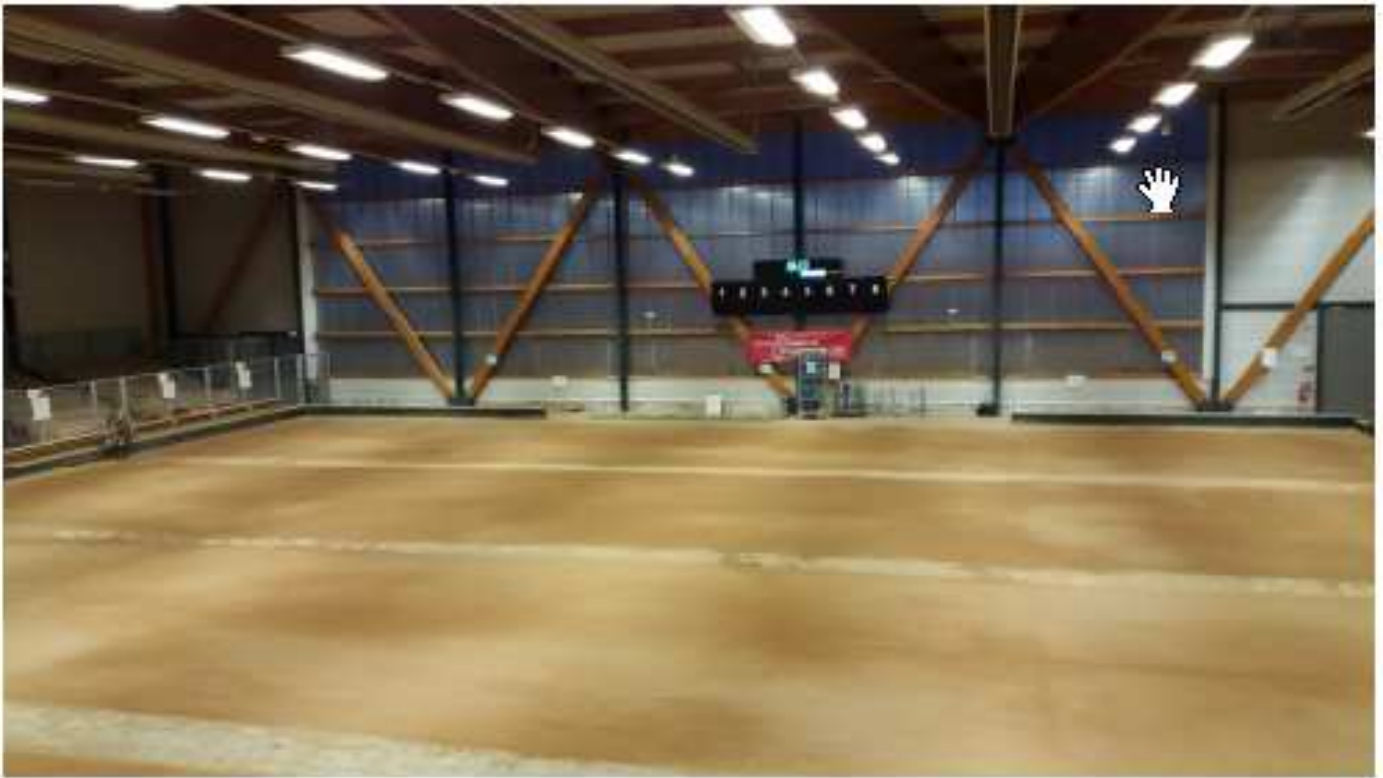
L'intérieur de l'Astroboules